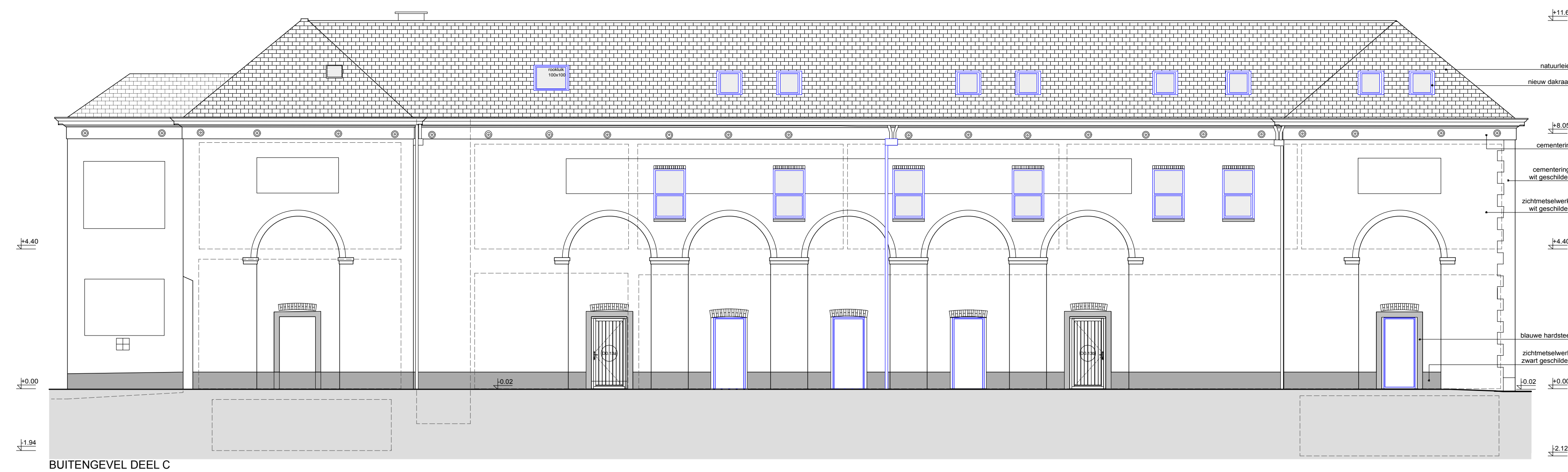
BUITENGEVEL DEEL C