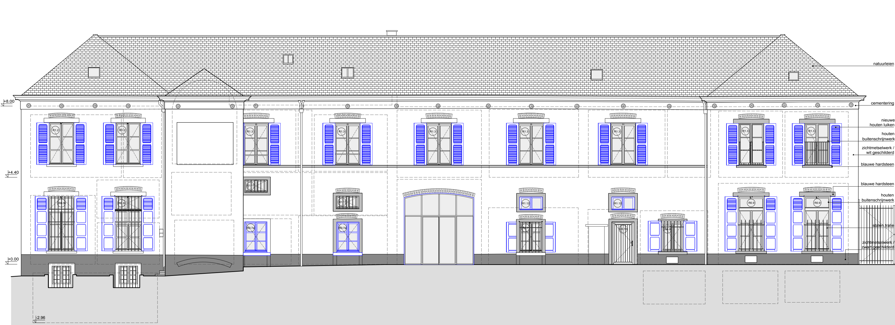
BUITENGEVEL DEEL B