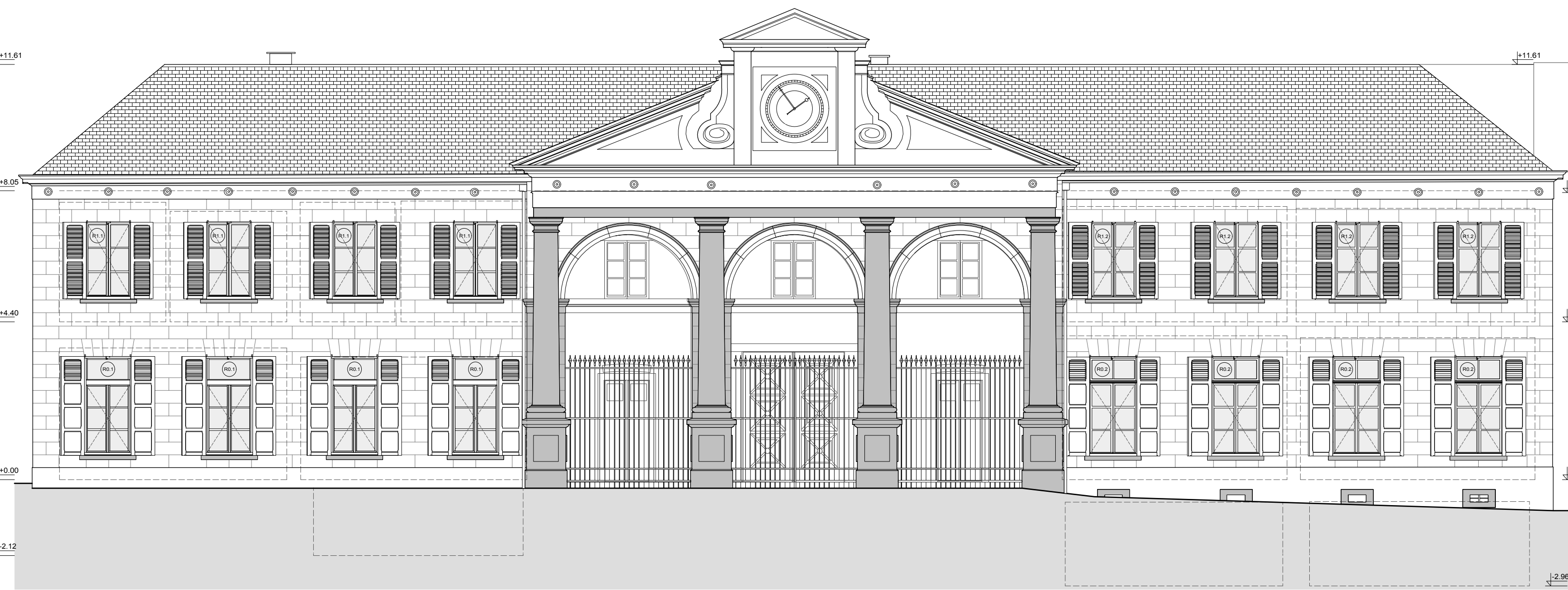
BUITENGEVEL DEEL A