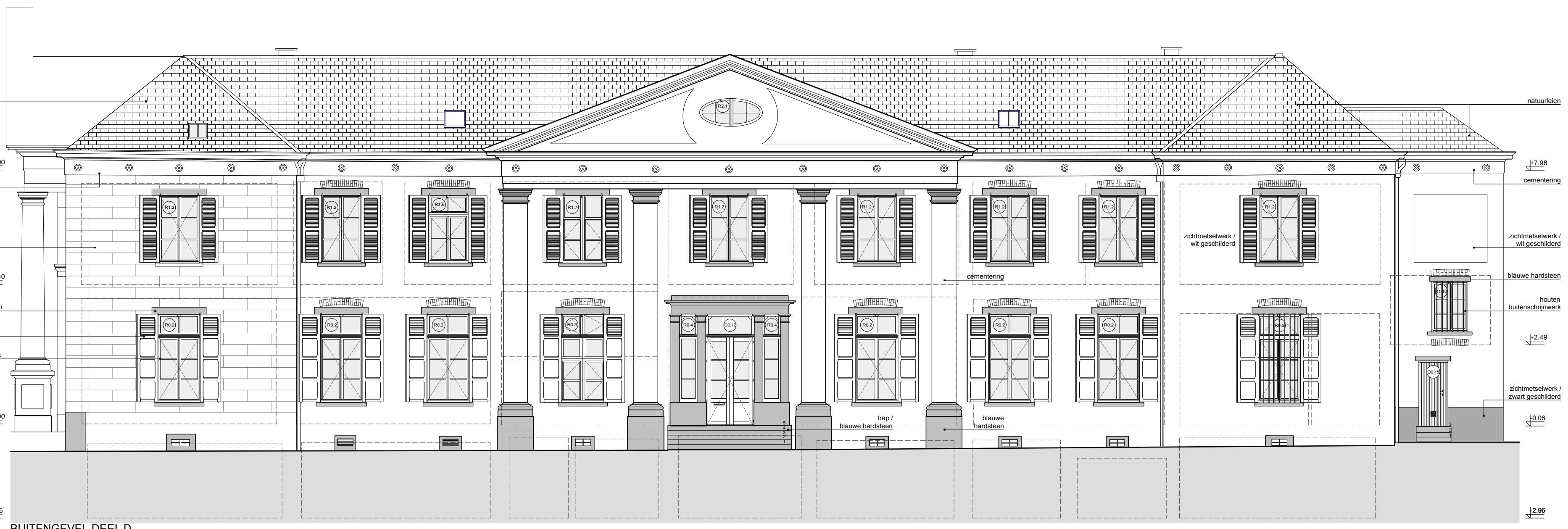
BUITENGEVEL DEEL D